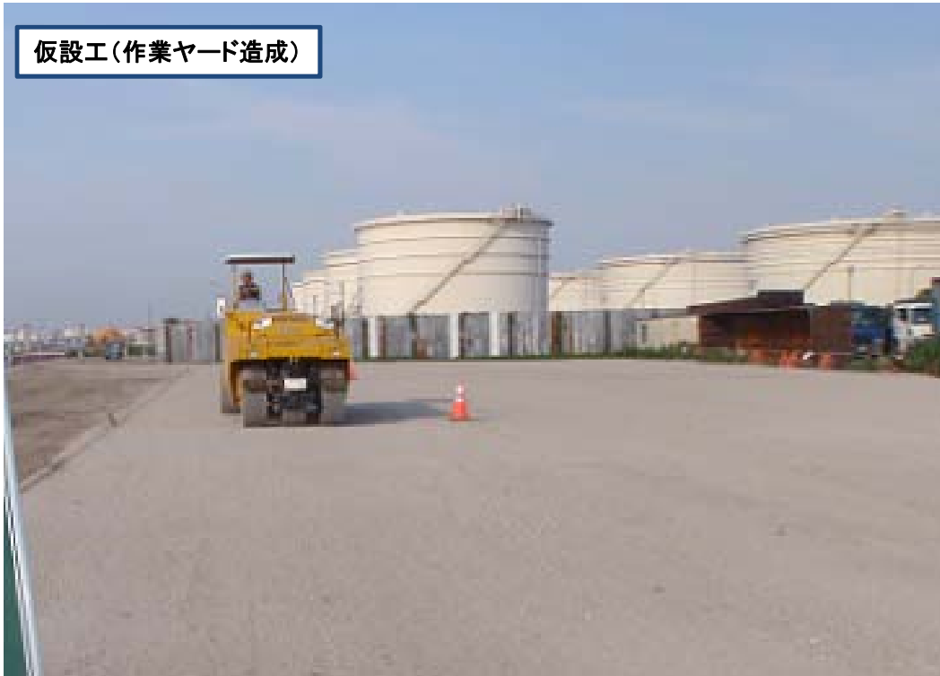
仮設工(作業ヤード造成)