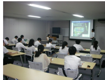
事務所にて概要説明