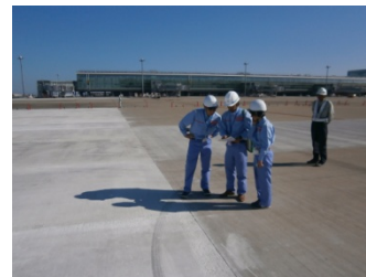
国際線エプロン見学状況