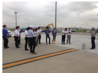
国際線エプロン見学状況