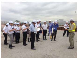
環八改良現場見学状況