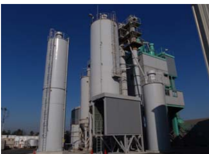
バッチャープラント