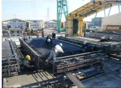
型枠・鉄筋組み立て