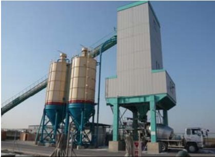
バッチャープラント