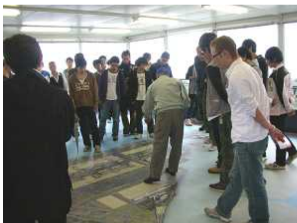
熱心に説明を聞く学生さんたち（3階展示室）