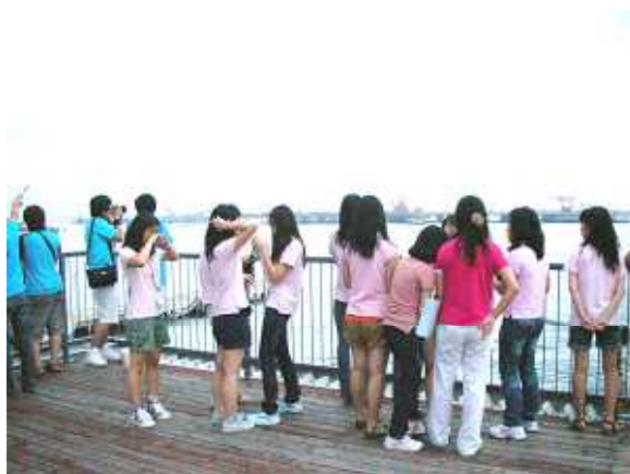
東京湾とD滑走路を一望できる屋上展望台