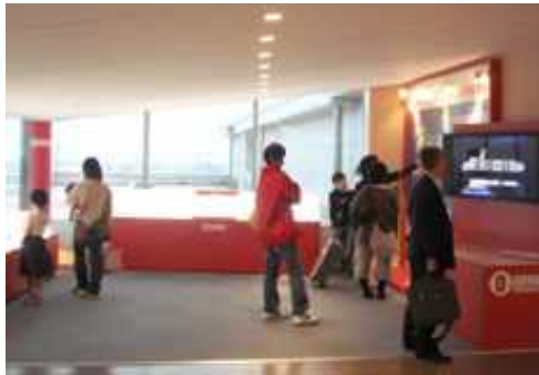
展示コーナー 全景

東京国際空港第二ターミナルビル5階 展示コーナー D滑走路建設工事に関するパネル展示、工事紹介映像などをご覧頂けます。 (羽田D滑走路JVホームページより)