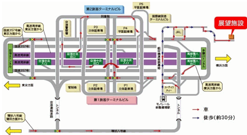
D滑走路展望台 位置図