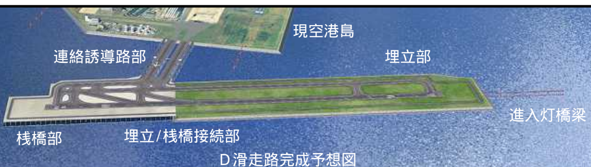
D滑走路完成予想図