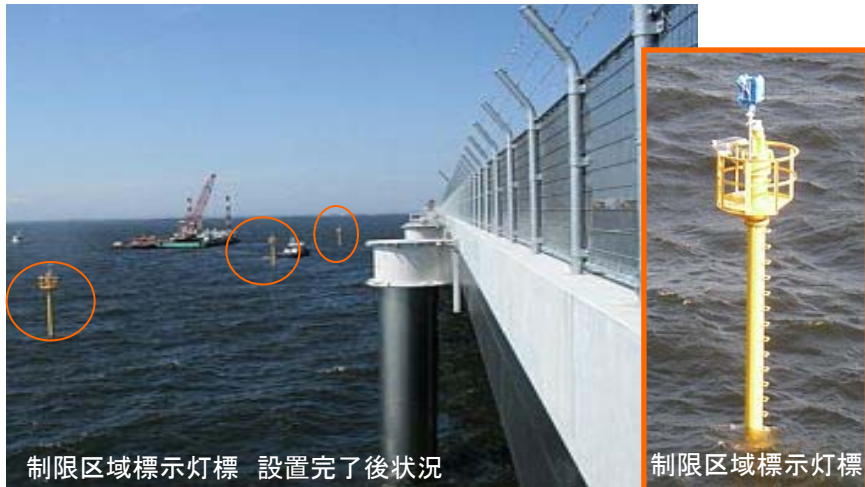
制限区域標示灯標 設置完了後状況