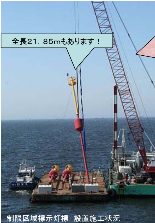
制限区域標示灯標 設置施工状況