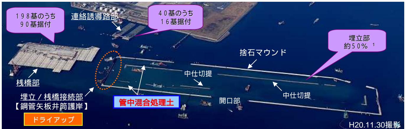
1 資材投入ボリュームに対する比率