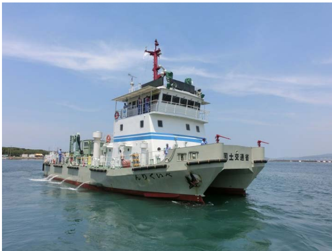
清掃兼油回収船「べいくりん」

展示ブースにおいては、ゴミ回収の方法について模型・パネルで説明し、海洋環境整備事業についてご理解頂きました。