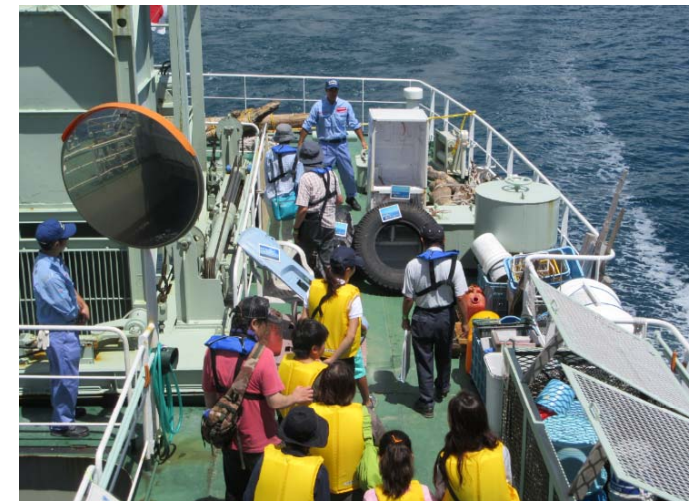
回収したゴミの説明