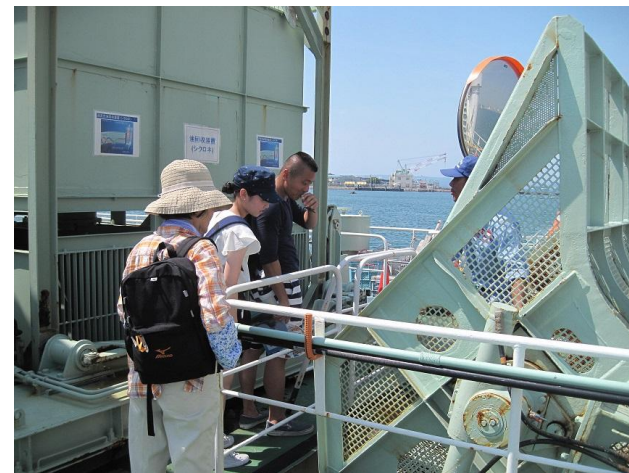
スキッパー前での説明

展示ブースにおいては、ゴミ回収の方法について模型・パネルで説明し、海洋環境整備事業についてご理解頂きました。