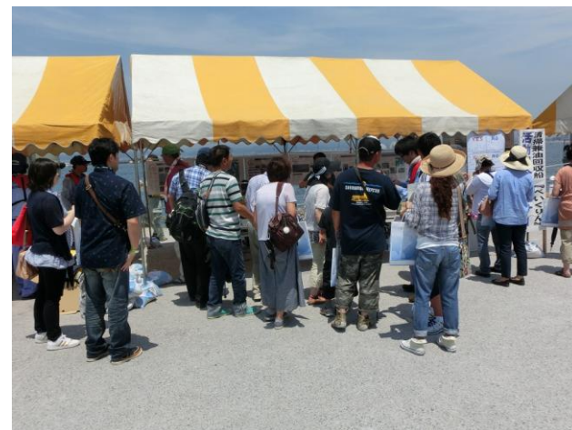
展示ブース前の状況