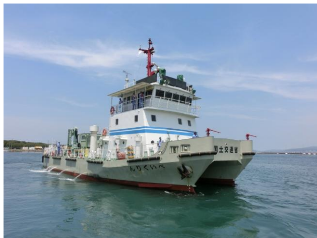
清掃兼油回収船「べいくりん」