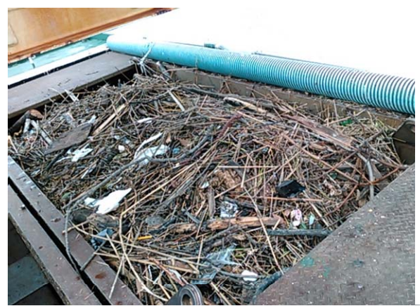
ゴミコンテナの状況(満杯)