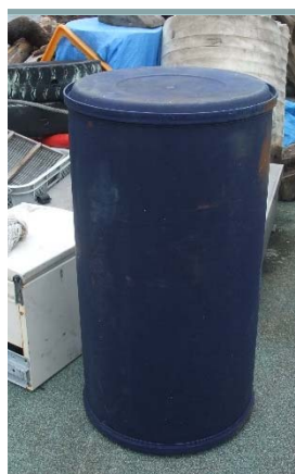
回収した大型プラスチック容器